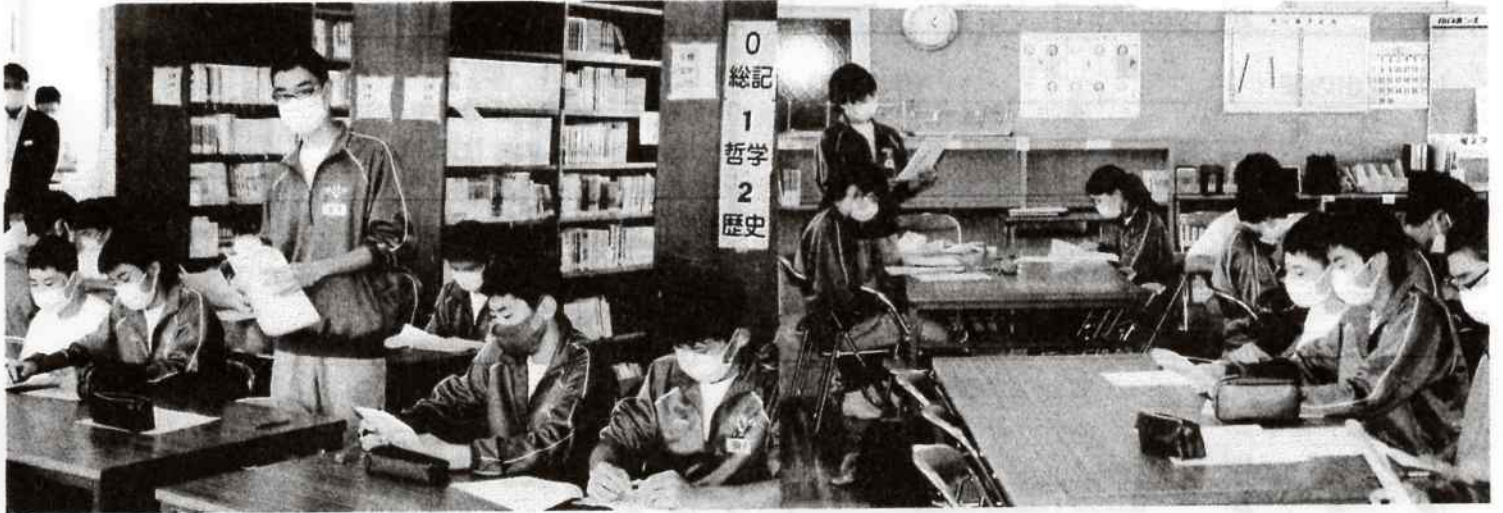
本来は全校生徒参加で行う生徒総会でしたが、今年は代議員制で実施しました。